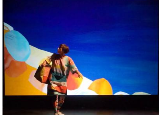
cue 4 / 19e minuut loopt bergafwaards, komt langs blauwe steen